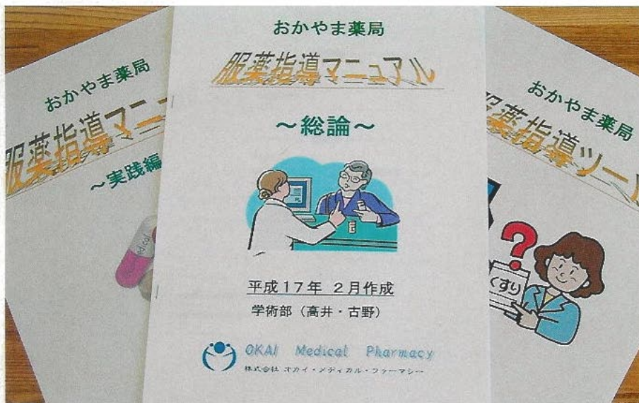
オカイ・メディカル・ファーマシーの服薬指導マニュアルは「総論」「実践編」「服薬指導ツール」の3部作